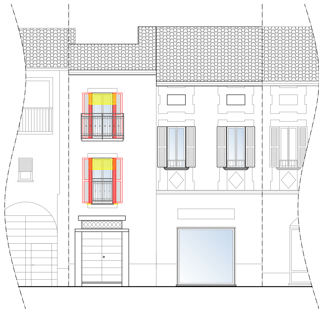
PROSPETTO SUD Sovrapposizione interventi